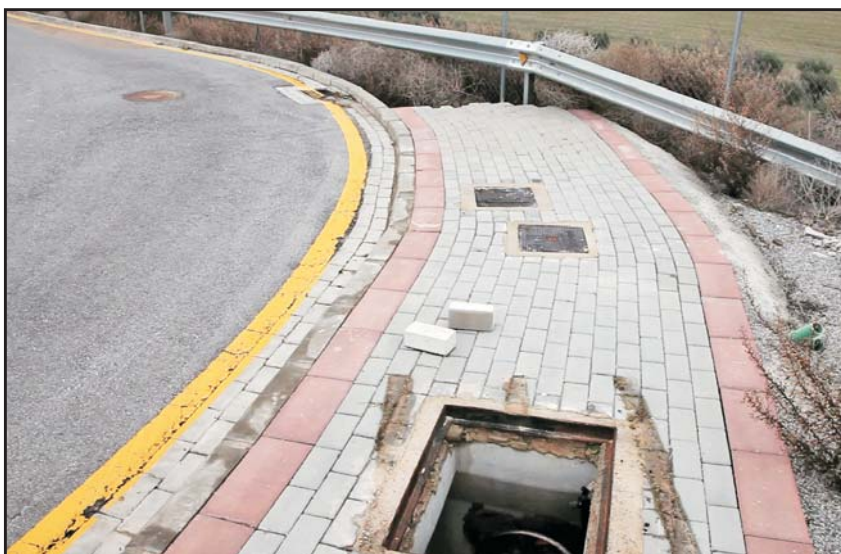
Foto: Arquetas sin cubrir, aceras que terminan en ningún sitio, zonas verdes inexistentes y un sinfín de irregularidades que se encuentran a cada paso.