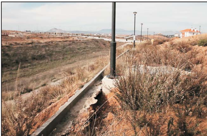
Foto: Paseo peatonal "en perfecto estado" para recepcionar y disfrutar por los otureños según el Sr. Alcalde