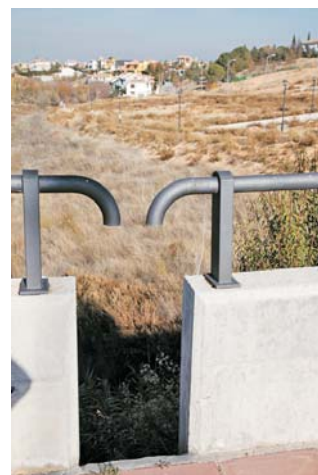
Terminado y en perfecto estado de recepción. "Todo todo receptionado" según el Alcalde.